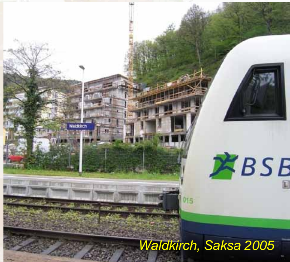
Waldkirch, Saksa 2005