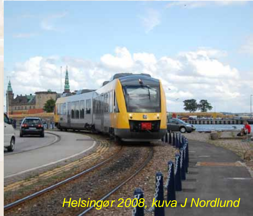
Helsingør 2008