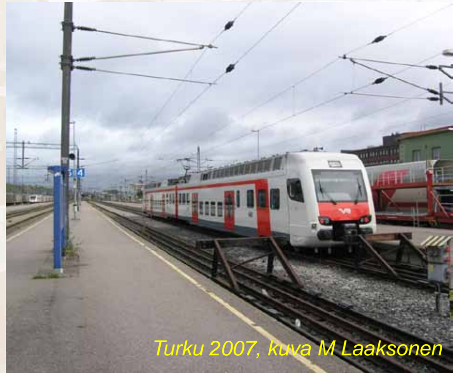
Turku 2007