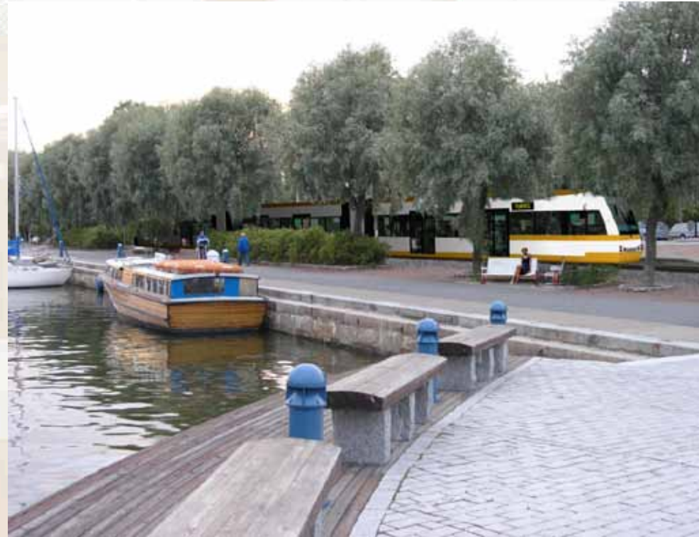
Duoraitiovaunu Uudenkaupungin Kalarannassa